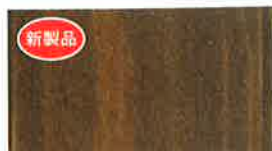
キシラデコールインテリアファイン #910 新製品・屋内用(水性)