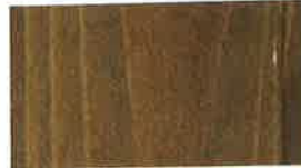
キシラデコール #110 屋外用(油性)