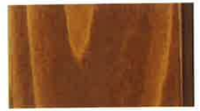
キシラデコールインテリア #607 従来品・屋内用(水性)