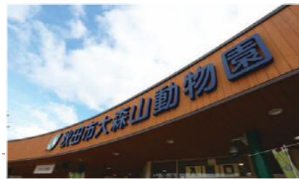
山の頂にある秋田市大森山動物園。地元の秋田中央塗装業組合に加入する塗装会社の有志が、毎年6月にボランティアで施設の木部を塗り替えている