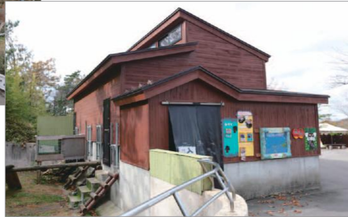
動物園内は10haを超える広さのため、毎年、塗装業組合と動物園が協議し、塗り替え対象のエリアを決めていくやり方。写真は、レッサーパンダの飼育小屋