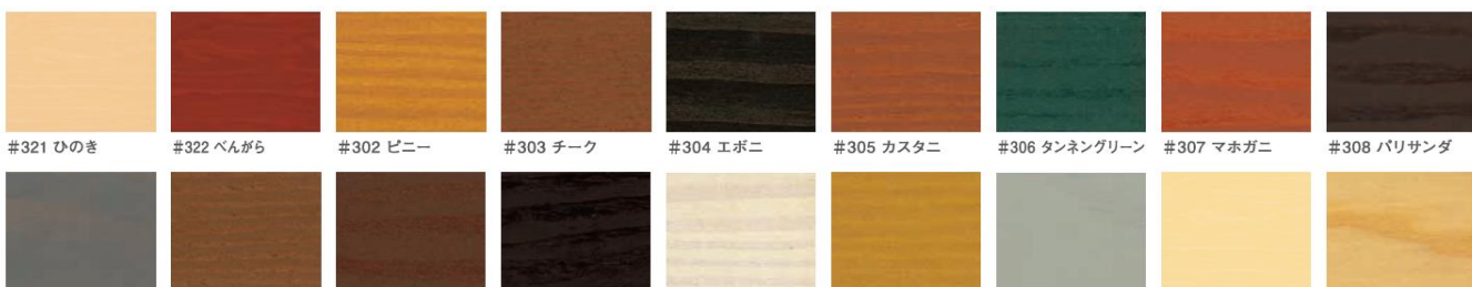
#321 ひのき #322 ベンがら #302 ピニー #303 チーク #304 エボニ #305 カスタニ #306 タンネングリーン #307 マホガニ #308 パリサンダ #309 シルバグレイ #310 オリーブ #311 ウォルナット #312 ジェットブラック #314 ワイス #315 スプルース #316 ブルーグレイ #320 やすらぎ #301 カラレス (下塗り専用)

この色見本は印刷物ですので、実際の色とは多少異なります。塗装見本でご確認ください。