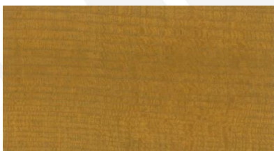
#415 スプルース NEW