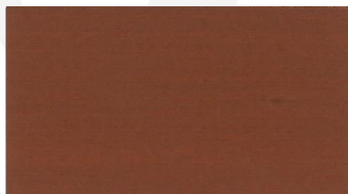
#407 マホガニ NEW