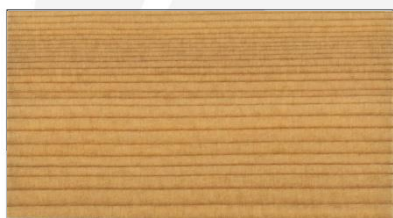
#401 カラレス (下塗り専用)