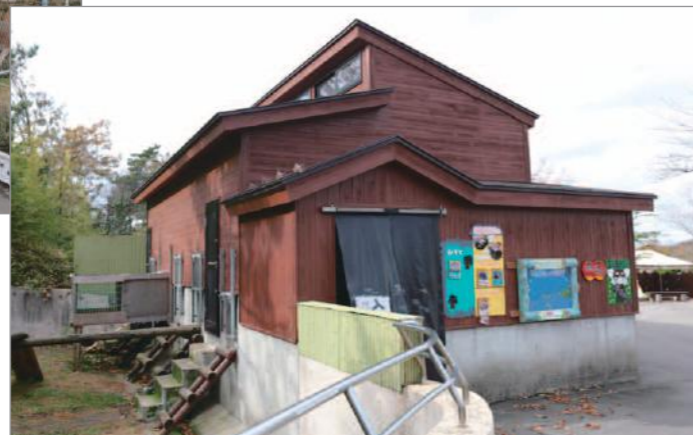
動物園内は10haを超える広さのため、毎年、塗装業組合と動物園が協議し、塗り替え対象のエリアを決めていくやり方。写真は、レッサーパンダの飼育小屋