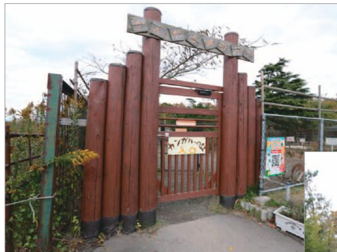
ボランティア塗装に使用しているのは、高耐久性の(水性)造膜型塗料「キシラデコールコンゾラン」。カンガルーの飼育ゾーンでは、木製の門柱を塗り替えた