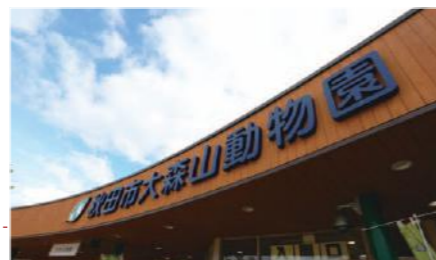
山の頂にある秋田市大森山動物園。地元の秋田中央塗装業組合に加入する塗装会社の有志が、毎年6月にボランティアで施設の木部を塗り替えている