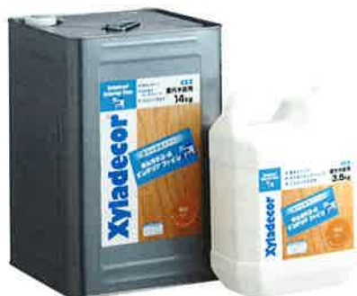
キシラデコール インテリアファインは14kgと3.5kgの2種類