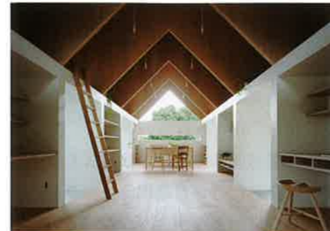
「コヤノスミカ」 川本 敦史+川本 まゆみ mA-style建築計画