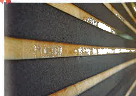
「大阪木材仲買会館」 白波瀬 智幸+興津 俊宏 竹中工務店