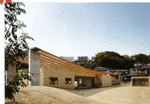
「二重屋根の家」 末光 弘和+末光 陽子 SUEP.