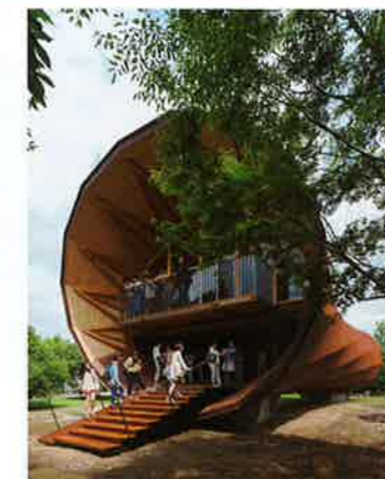
「岡山県立大学同窓会館」 岩本 弘光 岡山県立大学