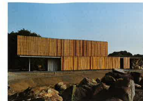
「山の上の家」 白浜 誠 白浜誠建築設計事務所