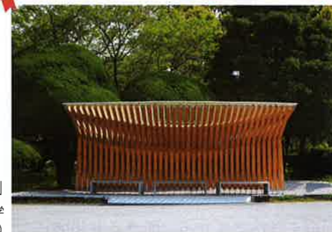
「鏡野公園バス停」 吉田 晋 高知工科大学 梅原 佑司 (梅原佑司デザイン事務所)