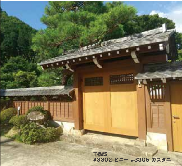
T様邸 #3302 ピニー #3305 カスタニ